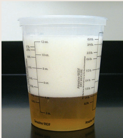
Eau + Pesticide